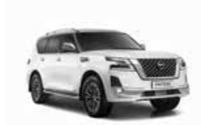
أبيض لؤلؤي (QAC) White Pearl