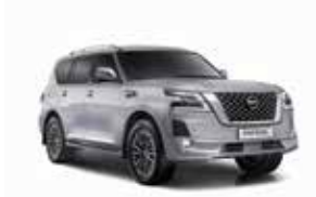
فضي (K23) Silver