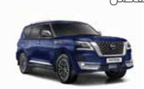
أزرق محيطي (BW5) Hermosa Blue