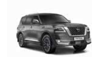
صخري حديدي (KAD) Metallic Slate