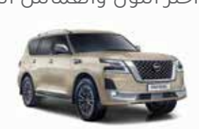
بيج فاتح (HAG) Nuance Beige