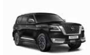
أسود (KH3) Black